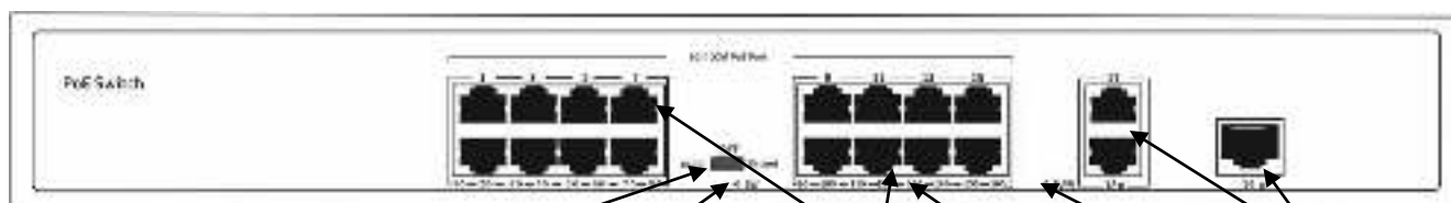
Переключатель режимов СИД режим POE порты СИД порта СИД питание Uplink порты