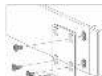
Монтаж на стену

Для монтажа коммутатора в стойку выполните следующие действия: