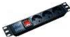
Выключатель с подсветкой