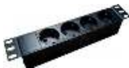
Без функций контроля