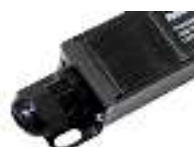
Подключение к клеммной колодке