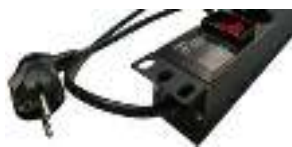
Вилка с неотключаемым кабелем питания