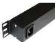
Входная розетка (без кабеля питания)