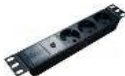
Светодиодный индикатор питания