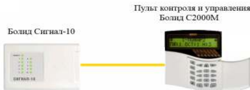
Рис. 1. структура простой системы

Представим себе простейшую охранно-пожарную систему. Всё просто, «Сигнал-10» подключается к «С2000М» по витой паре и всё работает, все шлейфы находятся под охраной. Можно разнести эти блоки вплоть до 1200 метров, всё будет работать.