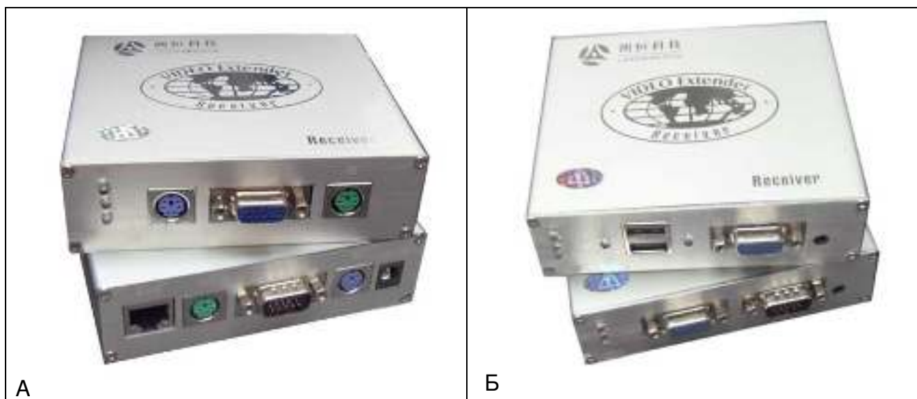
Рис.1 Внешний вид TA-VKM/1+RA-VKM/1, TA-VKM/2+RA-VKM/2, TA-VKM/4+RA-VKM/4, TA-VKM/6+RA-VKM/6 (А); TA-VKM/3+RA-VKM/3, TA-VKM/5+RA-VKM/5, TA-VKM/7+RA-VKM/7 (Б)